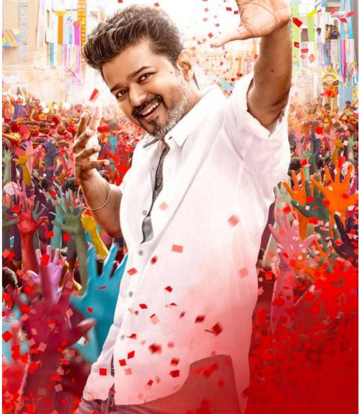
పరకు చెప్పేతారు. తాజాగా రిలీజ్ చేసిన ప్రకటించి మరంతా హిట్ క్రియేట్ చేశారు. దశవతి విజయ్ నటిస్తున్న ఈ జన నాయగన్ చిత్రాన్ని పచ్చే ఏడాది సంతాంతి బలిలోకి దించుతున్నారు. సంతాంతి సందడి మొదలయ్యే కంటే ముందే బాక్సాఫీస్ వద్ద విజయ్ సందడి ఘనం కానుంది. కోలీపుడిలో పాంగల్ అంటే విజయ్ సాధించిన లక్ష్యాలు, పనుల వద్ద అందరికీ గుర్తుకు వస్తుంటుంది. ఇక చివరగా ఇలా సంతాంతి బలిలోకి విజయ్ పచ్చి లక్ష్యాలు సునామీని సృష్టించబోతోన్నారని అందరికీ అర్థమై ఉంటుంది.

విజయ్ బర్డ్ దే సందర్భంగా రిలీజ్ చేసిన ఫస్ట్ లుక్ పోస్టర్లకు మంచి స్పందన వచ్చింది. స్టైలిష్ లుక్ లో విజయ్ తన ఫ్యాన్స్ ను ఇట్టే కట్టడం చేశారు.